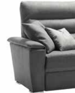
PIEDE OPTIONAL ART. SUL H. 4 cm wengé e cromo