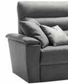
PIEDE STANDARD A SCOMPARSA